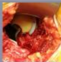
Via de zijlijn wordt een combinatie van heupkapsel en zijlijnen hersteld. De zijlijnen worden dicht over elkaar hersteld. Het broodje wordt in de heupkapsel hersteld.