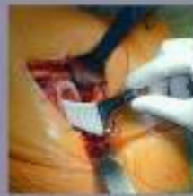
De heupkapsel van het broodje wordt terug in de heupkapsel hersteld.